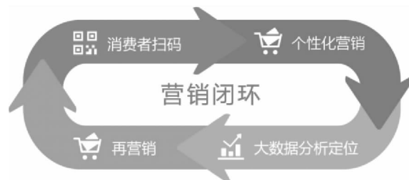
图3 二维码营销策略管理闭环图

二维码营销策略管理主要是针对终端消费者进行管理,一方面加强与消费者的互动,增加消费者对企业产品的忠诚度;另一方面,企业可以通过这些策略收集到终端消费者的信息,对消费者行为爱好进行分析,帮助企业调整营销策略,进行精准营销,形成营销闭环。二维码营销策略管理闭环图见图 3。